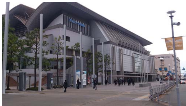
（日本臨床外科学会 福岡にて）