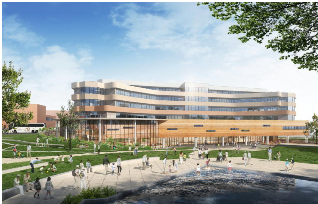
むつ総合病院新病棟完成イメージ図