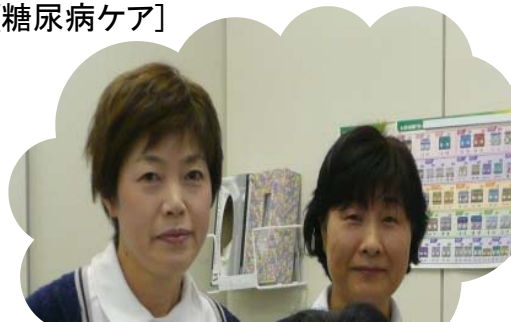
[ストーマケア・メンバー]